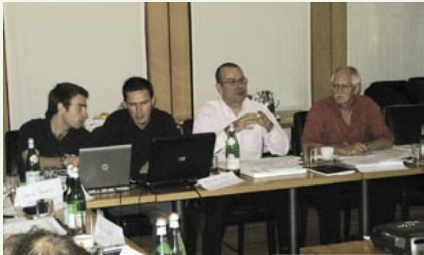
De Franse en Engelse vertegenwoordigers aan de vergadertafel tijdens de eerste bijeenkomst van het Leonardo-project in het Belgische Leuven